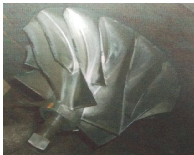
Gambar Kerusakan Akibat Gesekan