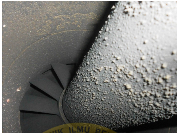
Foto Kerusakan Komponen Luar Turbocharger