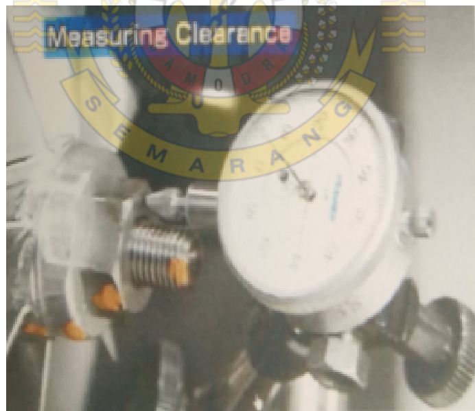
Gambar Pengukuran Axial dan Radial Clearance