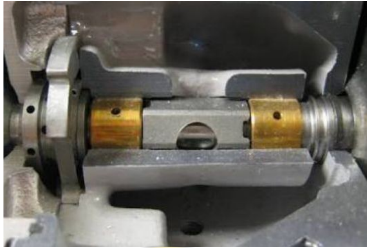
Foto Kerusakan Komponen Dalam Turbocharger