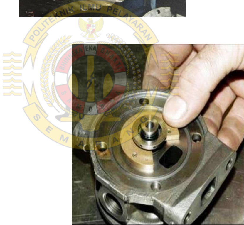
Gambar Kegiatan Overhaul Turbocharger