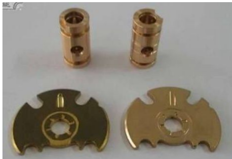
Gambar Kerusakan Bush Bearing dan Komponen Dalam lainnya