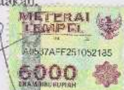
ARIF LUKMAN HAKIM NIT 50135014 T