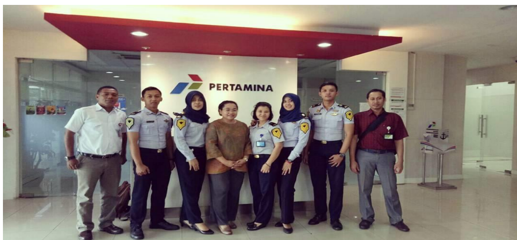
FOTO CADET BERSAMA CREW KAPAL