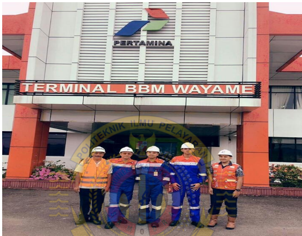
FOTO CADET PADA SAAT MELAKSANAKAN MANGEMENTVISIT