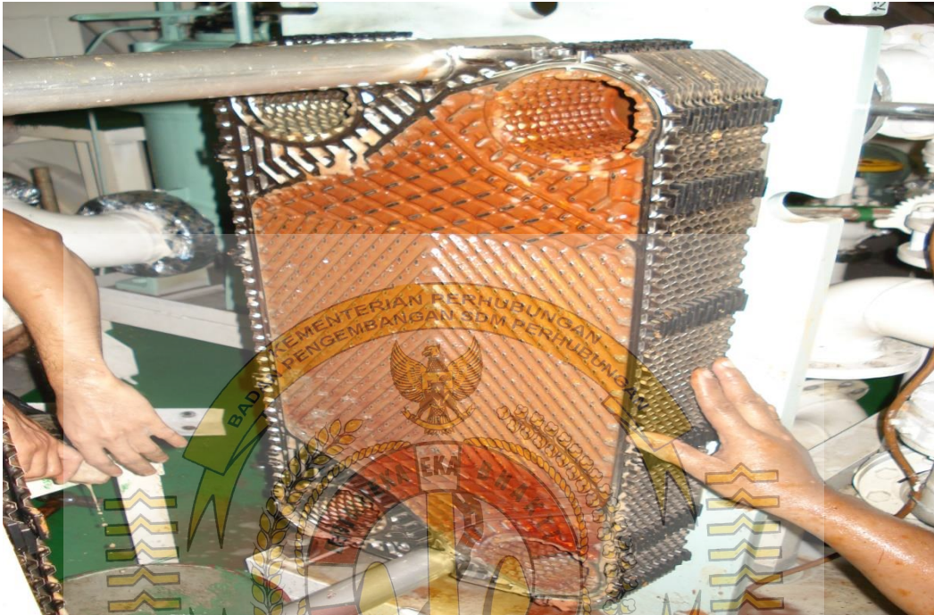
Gambar cooler yang sudah dibersihkan