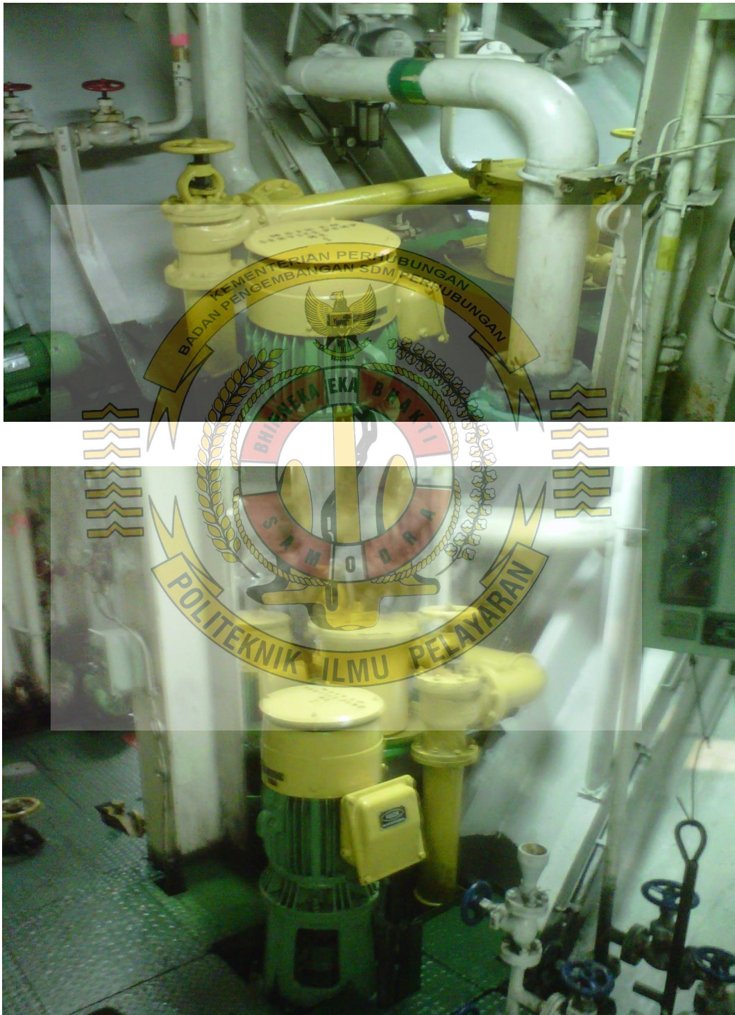
Gambar LO Pump