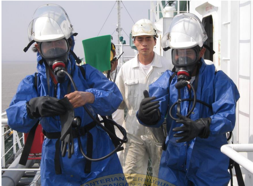
Gambar 3. Awak kapal bersiap untuk melakukan spray distilled water menggunakan breathing apparatus .