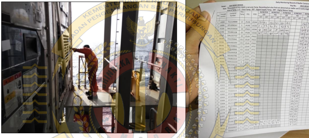
Gambar 5 proses pengecekan rutin reefer container oleh Ordinary Seaman (kiri) dan lembar catatan suhu (temperature log) ketika pengecekan rutin (kanan)