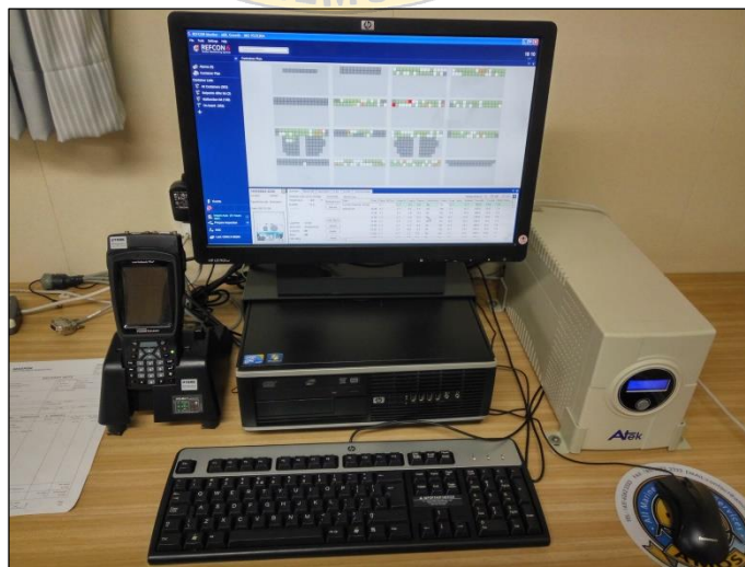
Gambar 6 tampilan komputer untuk memonitor reefer container dari Cargo Office Room