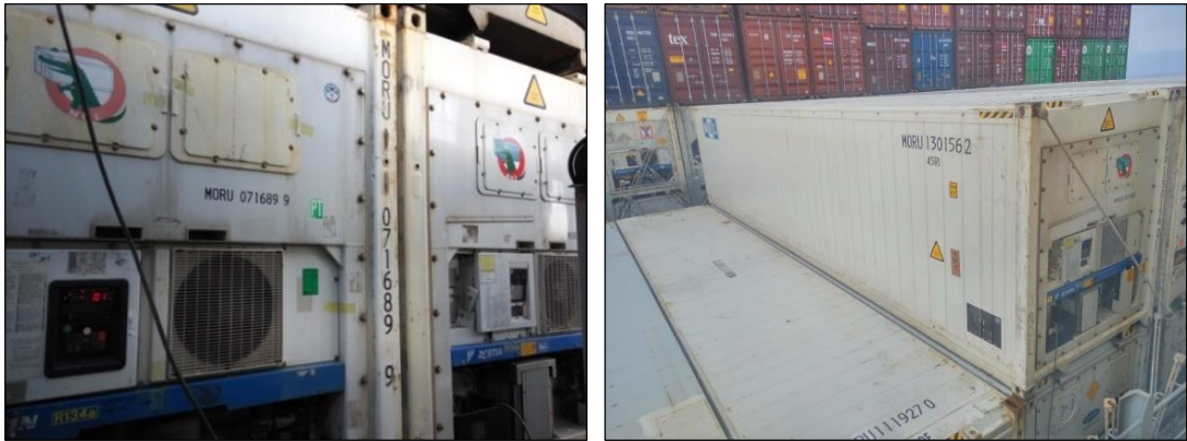
Gambar 4 Reefer Container di atas kapal