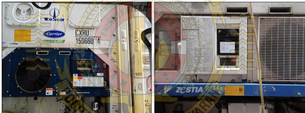
Gambar 8 contoh manufacturer reefer container yang berasal dari Carrier (kiri) dan Daikin (kanan)