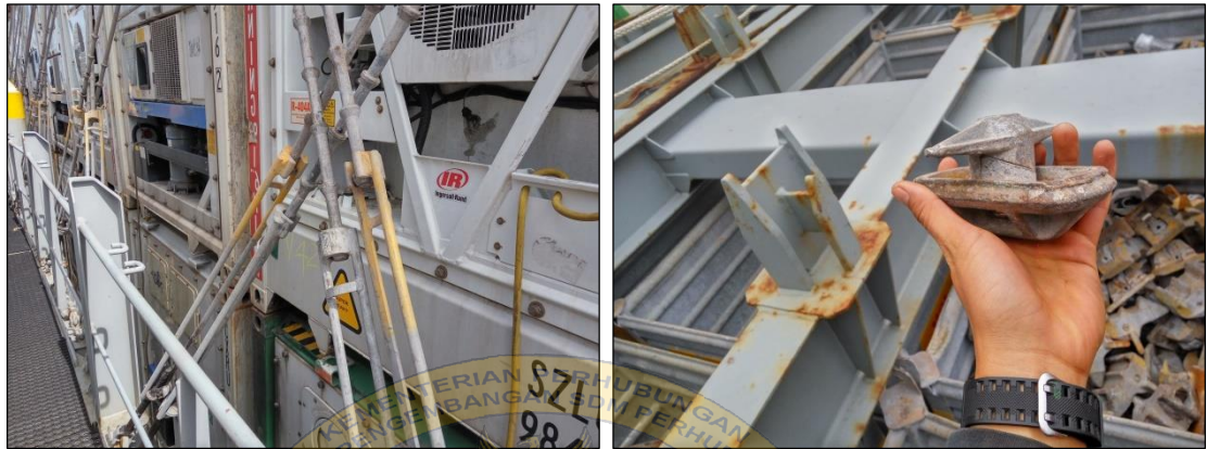
Gambar 7 contoh complete lashing (kiri) dan twisttacker (kanan)