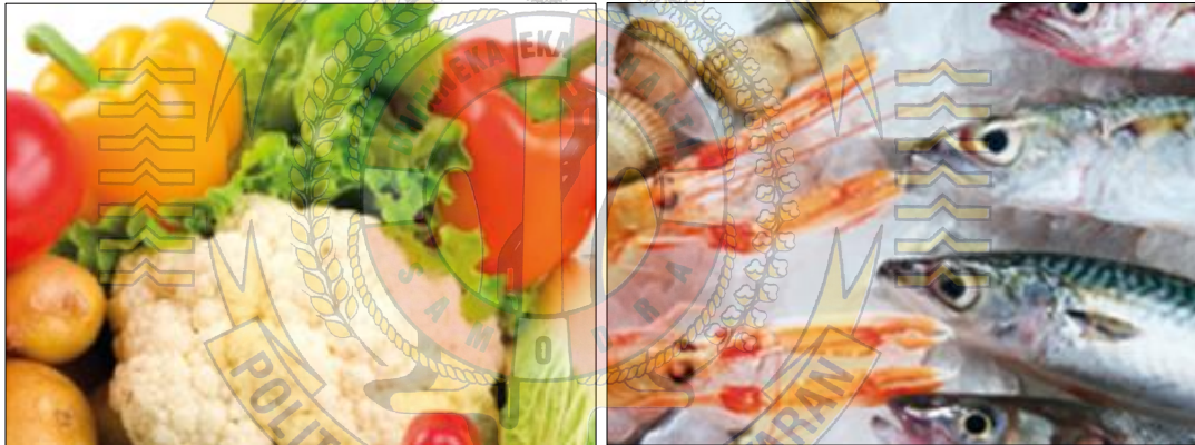
Gambar 2 Muatan dingin (kiri) dan Muatan beku (kanan)