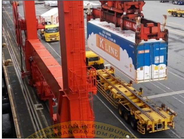
Gambar 1 Penanganan muatan di pelabuhan Tokyo, Jepang.