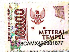
SAVA ANDROMEDA 582111128196 N

Mengetahui/Menyetujui KETUA PROGRAM STUDI NAUTIKA