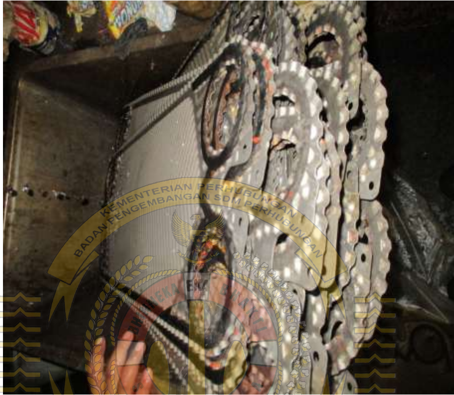
Dokumentasi kondisi Fresh Water Generator setelah dilakukan pembersihan