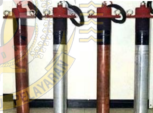
Gambar 9 : rumah anoda