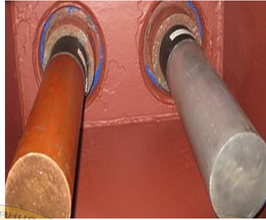
Gambar 2 : foto Anoda normal dari kapal lain