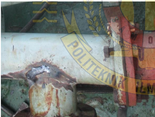
Gambar 7 : kebocoran pipa air laut menuju ke F.W Cooler