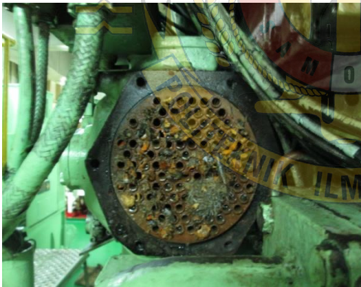
Gambar 3 : LO Cooler Aux Engine penuh marine growth