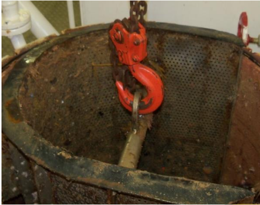
Gambar 5 : Strainer Sea Chest kotor