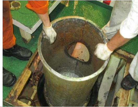
Gambar 6 : Strainer Sea Chest bersih