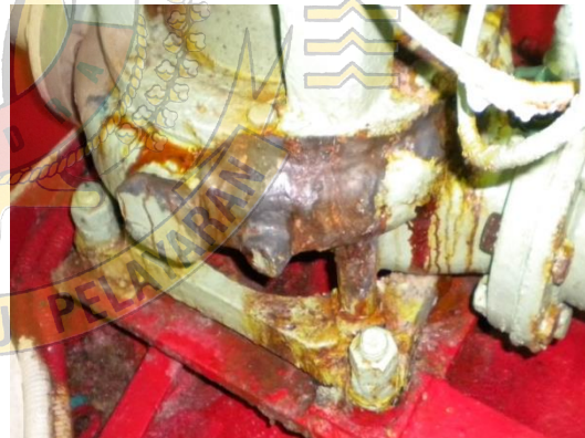
Gambar 8 : karat akibat kebocoran air laut