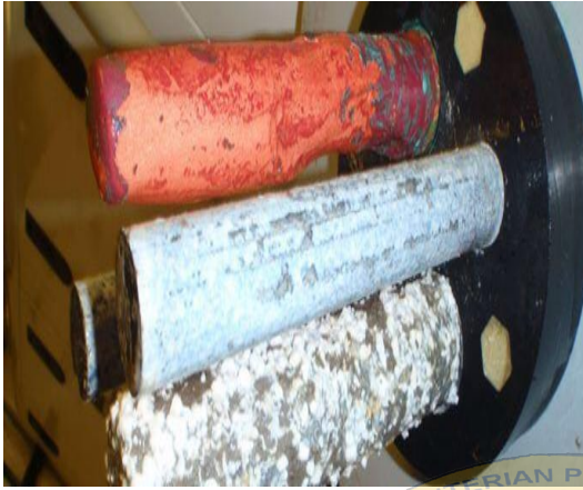
Gambar 1 : Anoda MGPS yang terakumulasi deposit berwarna putih