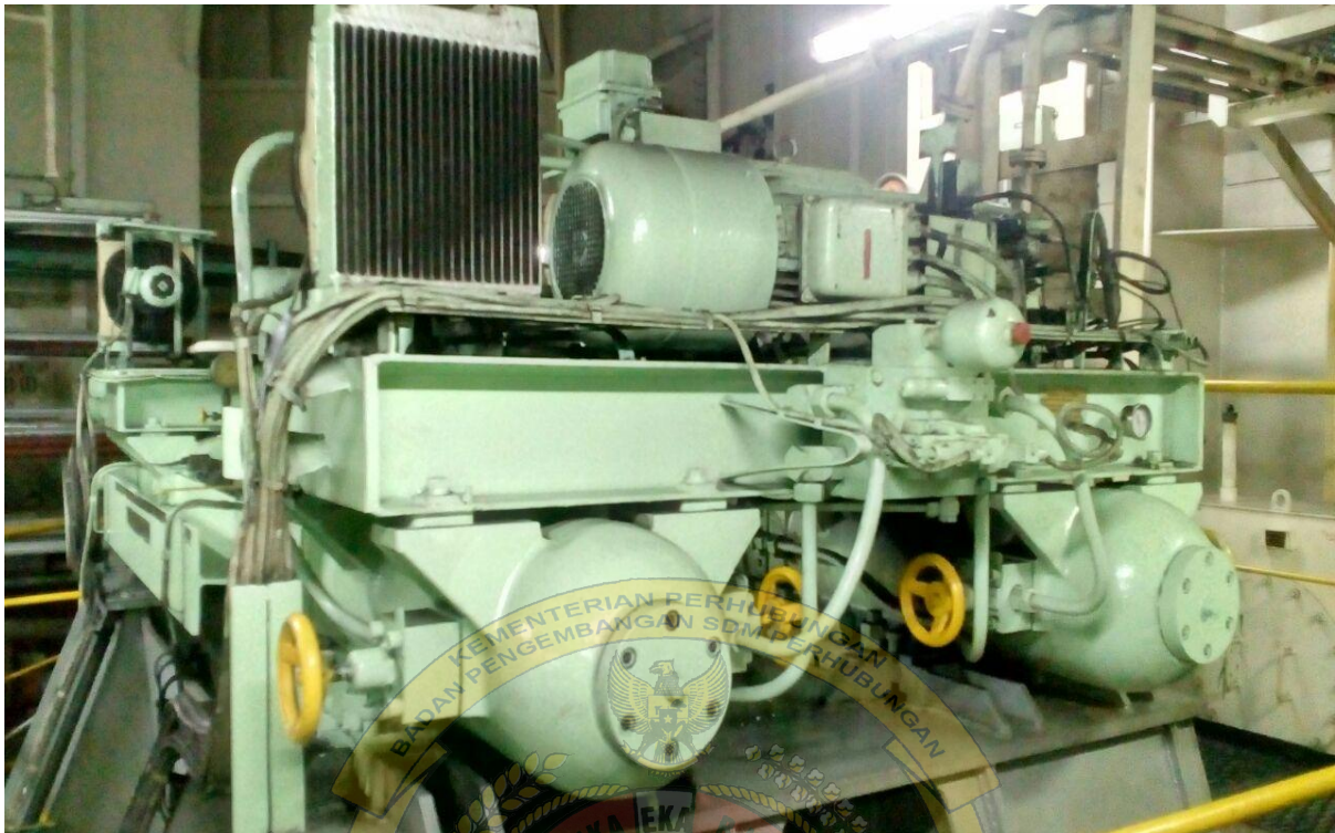
Gambar.1 : 1 set steering gear dari samping