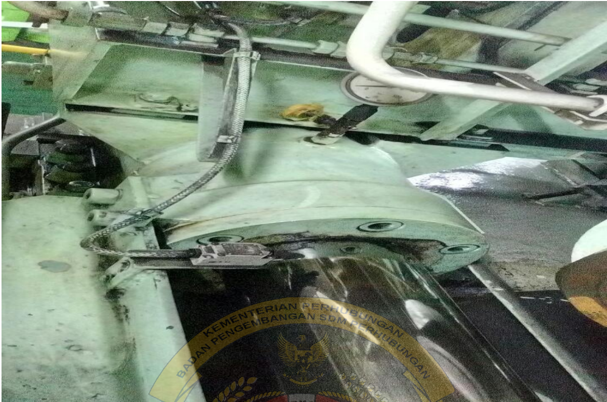
Gambar 7 : hidrolik steering gear