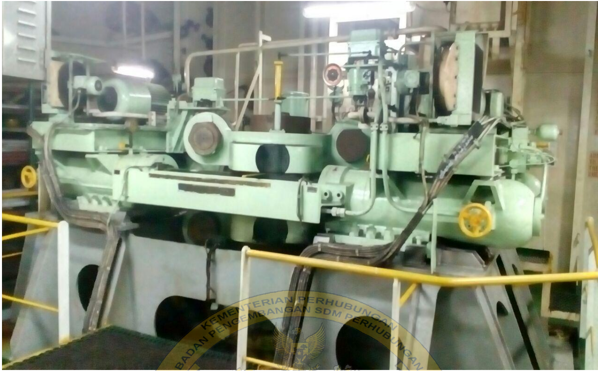
Gambar 3 : steering gear dari depan