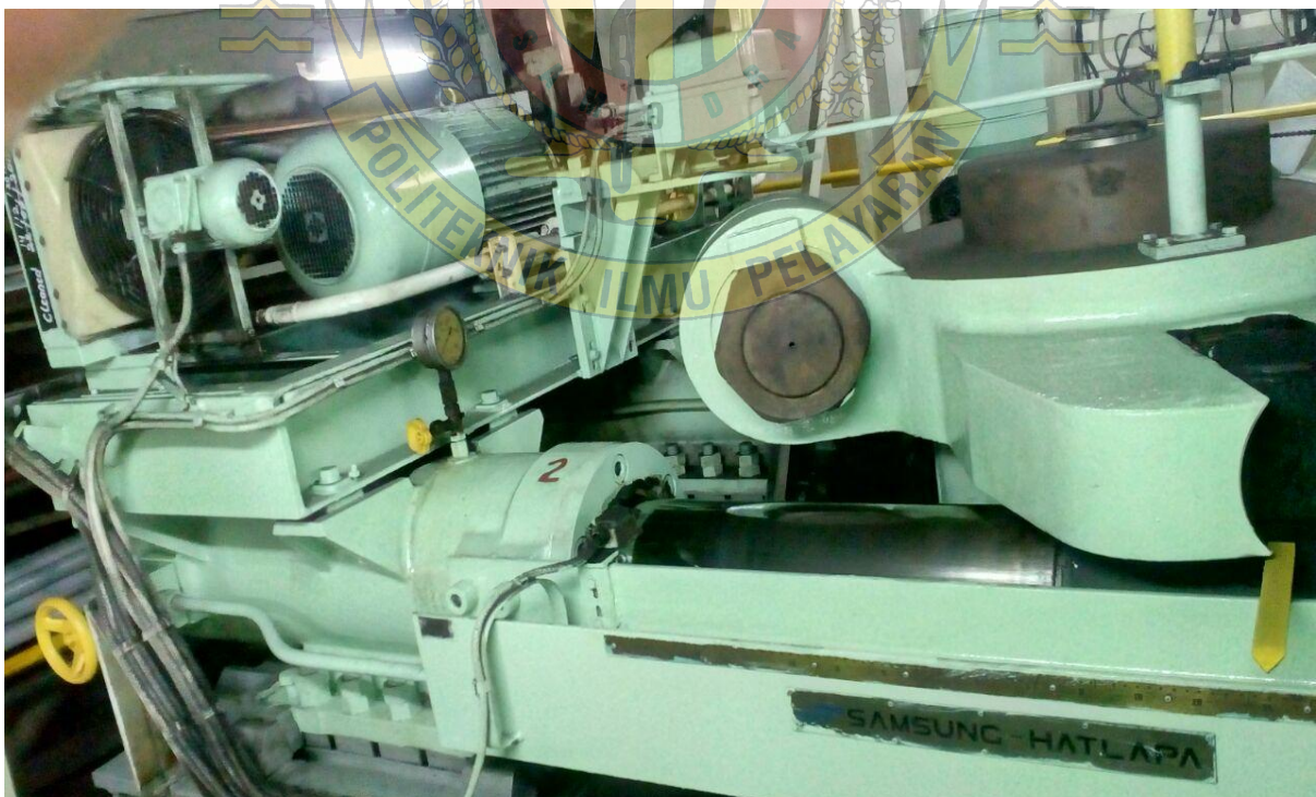
Gambar 2 : steering gear rudder stock