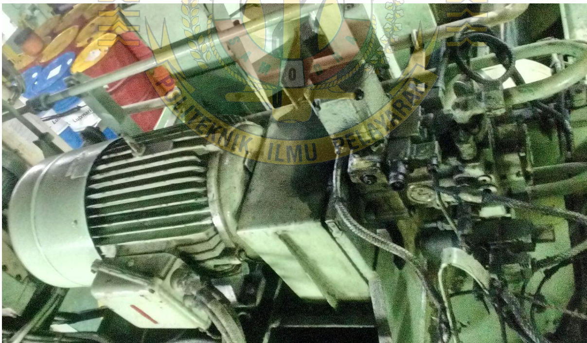
Gambar 6 : pompa hidrolis steering gear