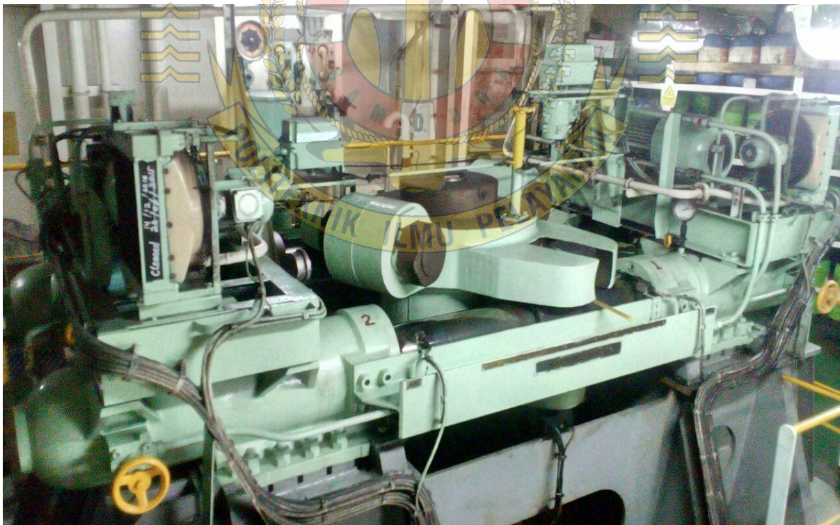
Gambar 4 : sistem gerak hidrolik steering gear