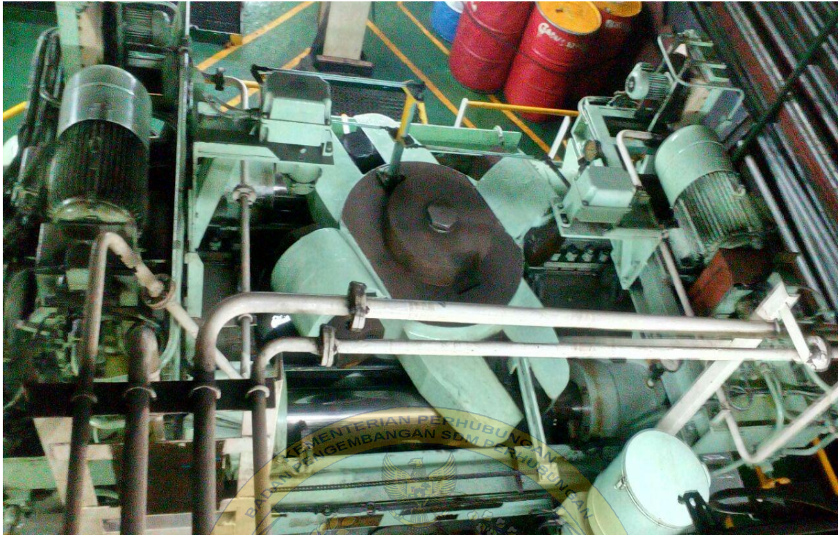
Gambar 5 : gambar steering gear tampak dari atas