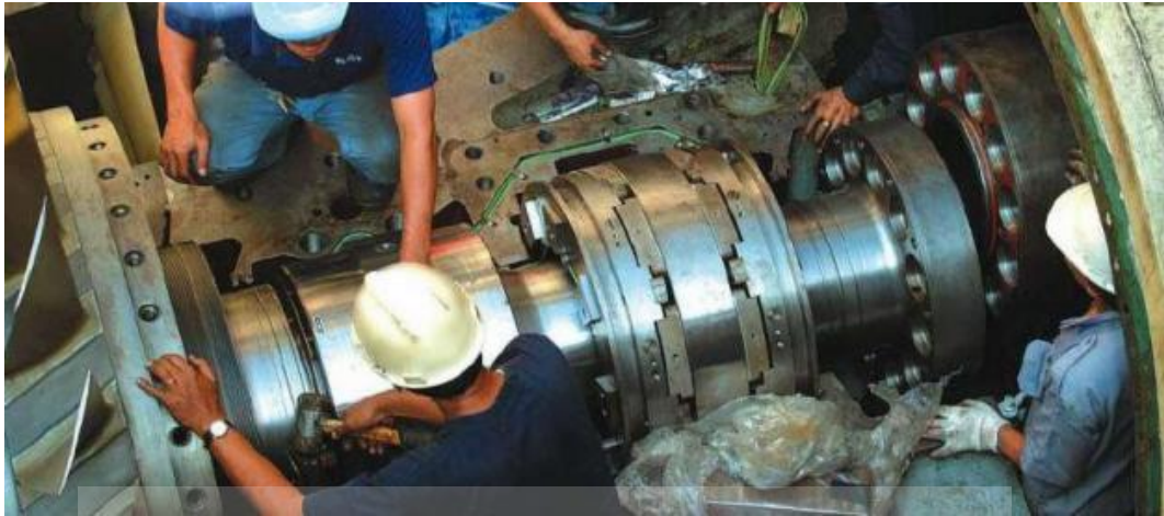
Proses perbaikan dan penggantian suku cadang kapal