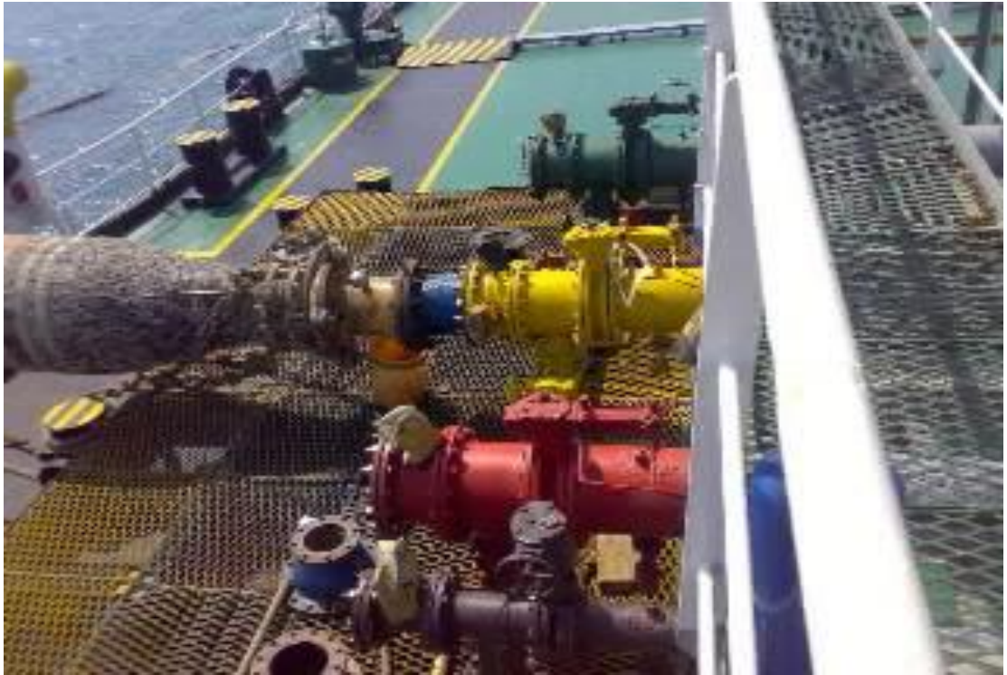
Gambar 3. Cargo manifold MT. Sinar Jogya