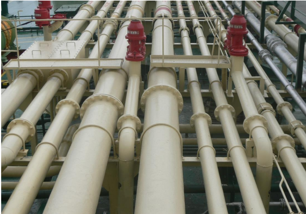
Gambar 5. Pipe Line cargo MT. Sinar Jogya