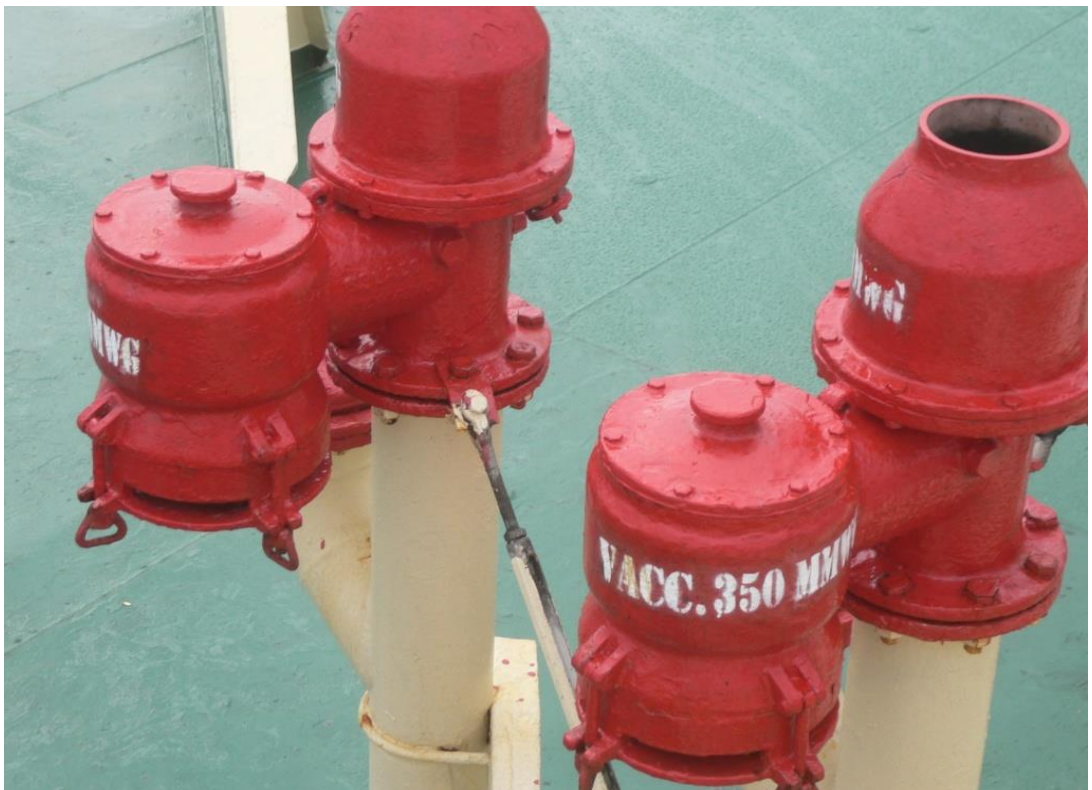
Gambar 4. PV Valve MT. Sinar Jogya