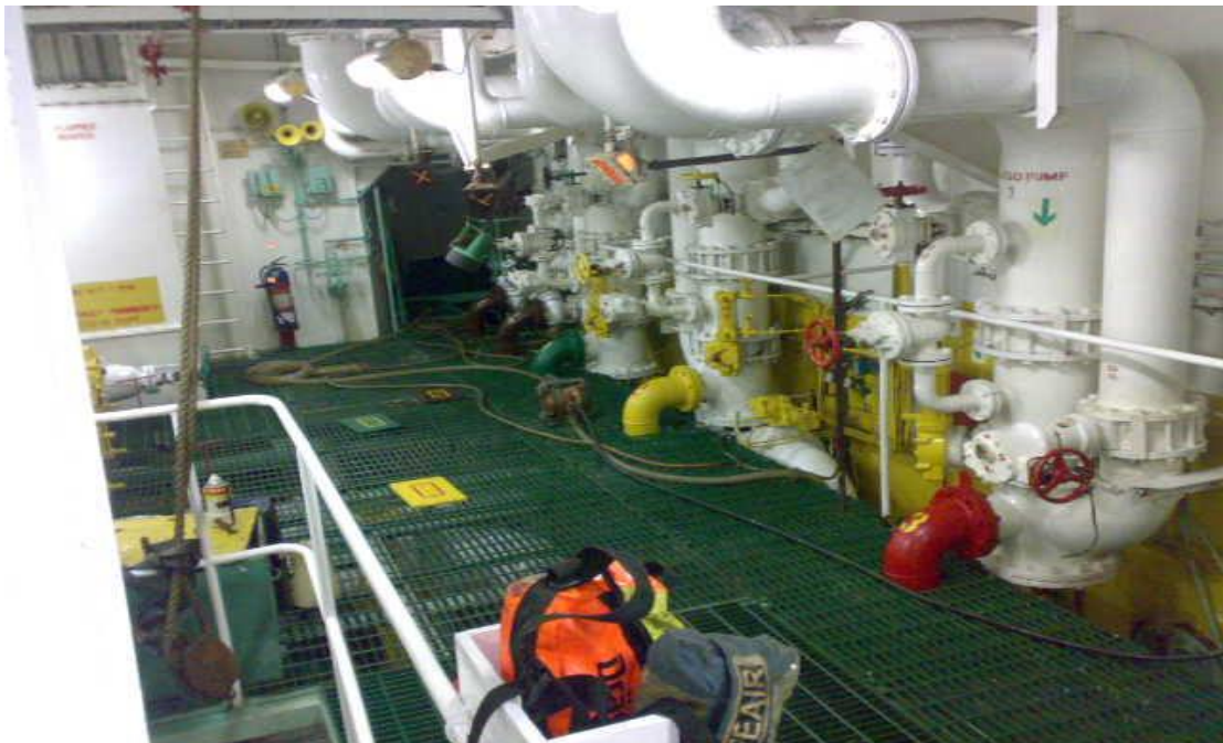
Gambar 2. Cargo Pump di kapal MT. Sinar Jogya