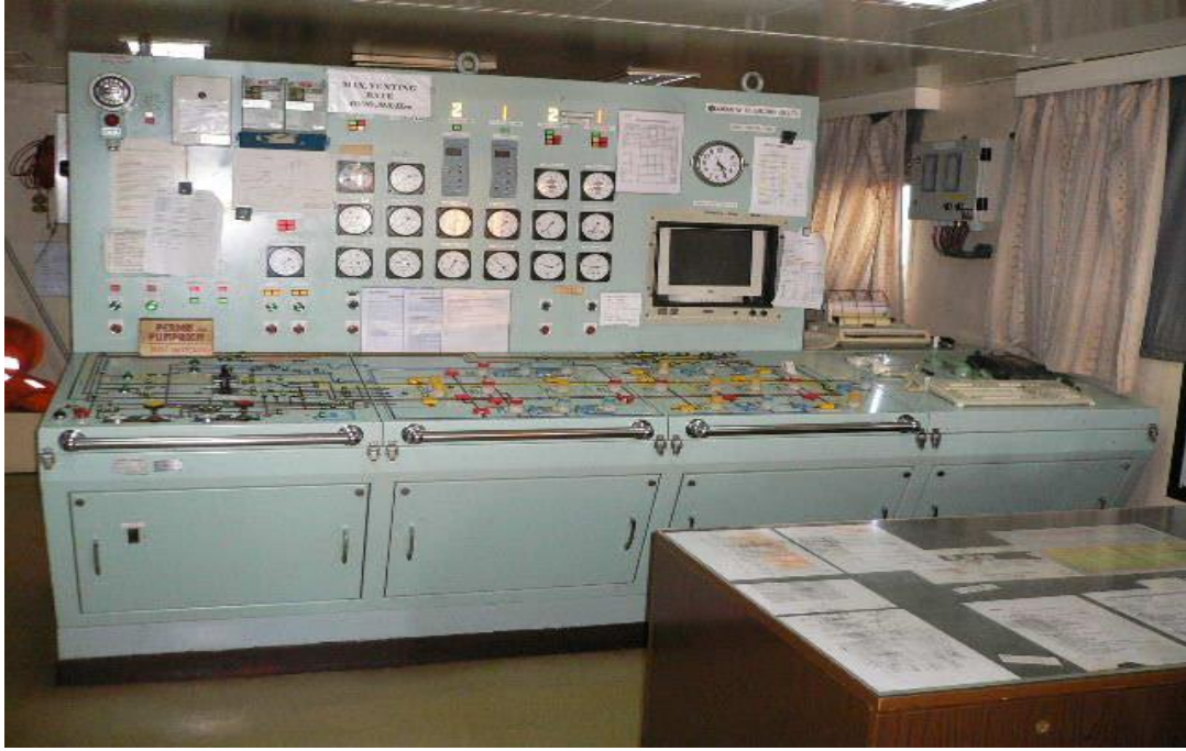
Gambar 1. Cargo Control Panel yang terletak di CCR ( Cargo Control Room ) kapal MT. Sinar Jogya