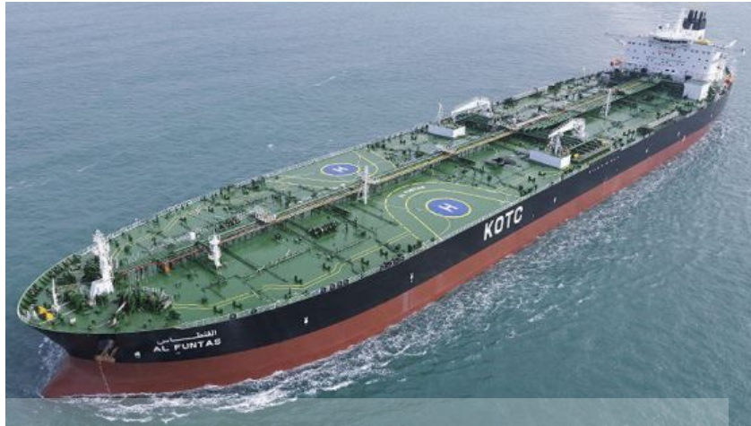
Gambar 4.3 Helipad pada kapal ULCC