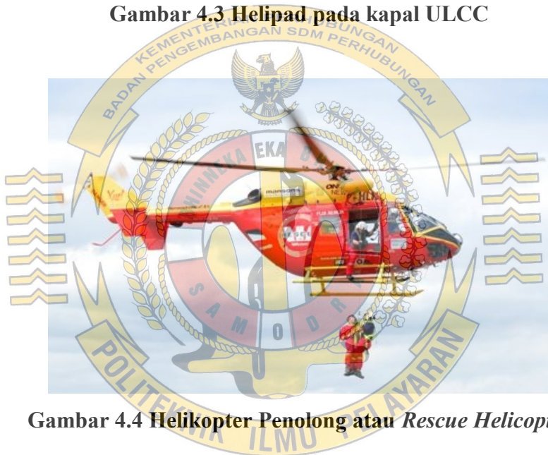
Gambar 4.4 Helikopter Penolong atau Rescue Helicopter