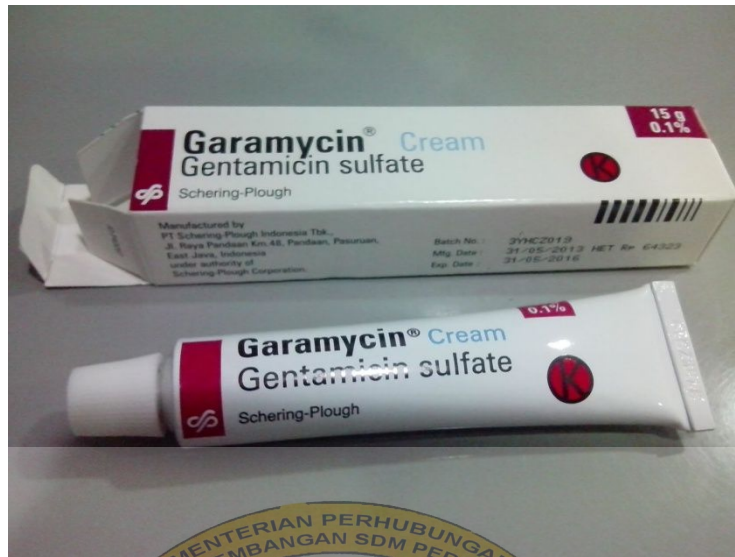
Gambar 4.11 Contoh obat salep