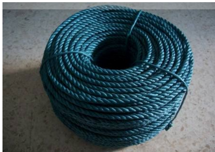
Gambar 4.5 Tali Penolong