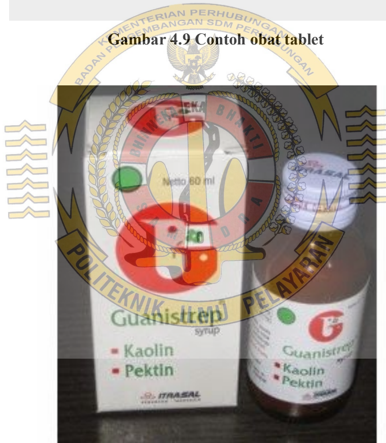
Gambar 4.10 Contoh obat sirup