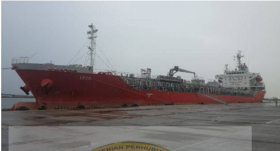
Gamba 4.1 MT. IRIS Oil/Chemical Tanker Class II and III