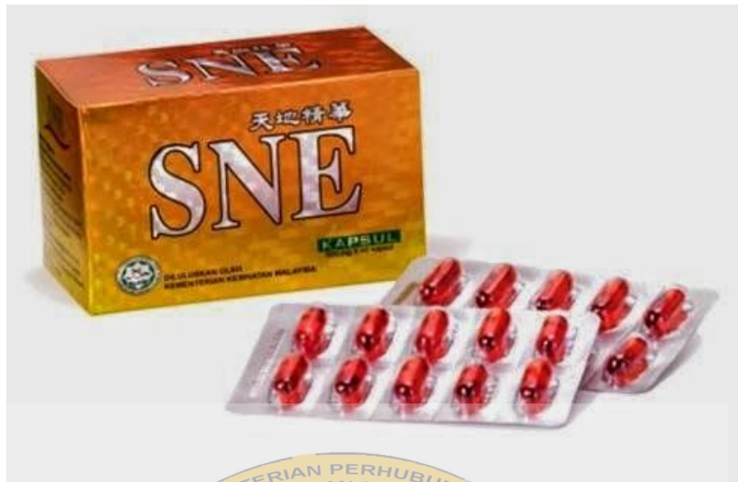
Gambar 4.9 Contoh obat tablet