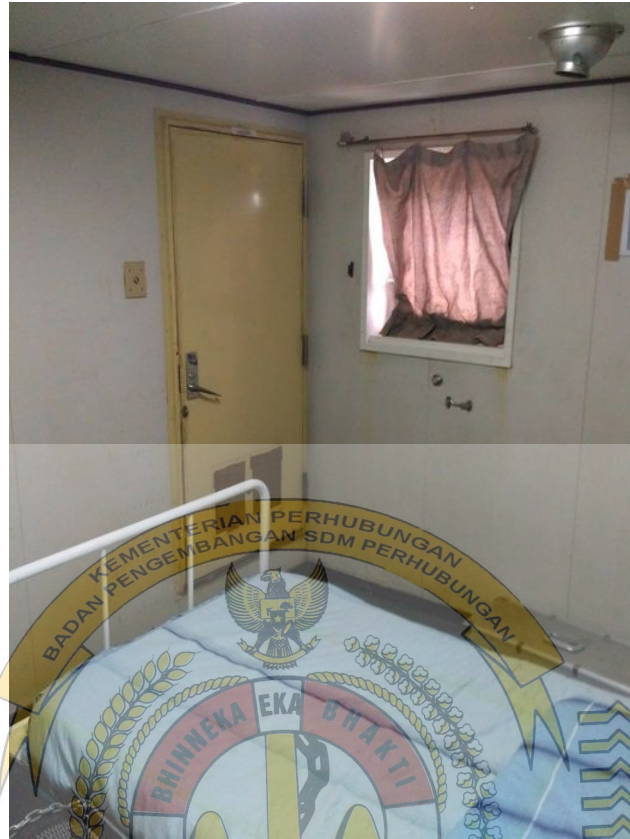
Gambar 4.7 Rumah sakit kapal MT. Iris