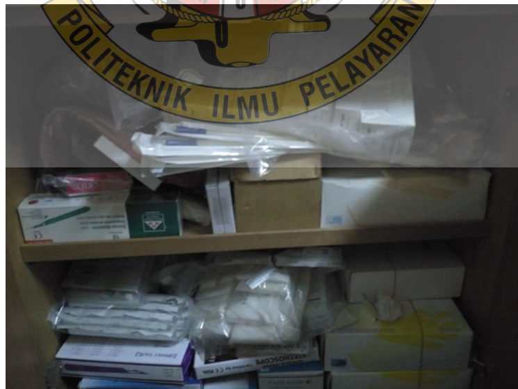
Gambar 4.8 Lemari obat yang tidak tertata rapi